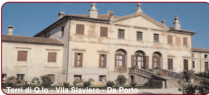
Torri di Q. Io - Villa Slaviero - Da Porto