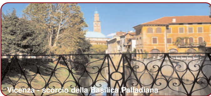
Vicenza - scorcio della Basilica Palladiana