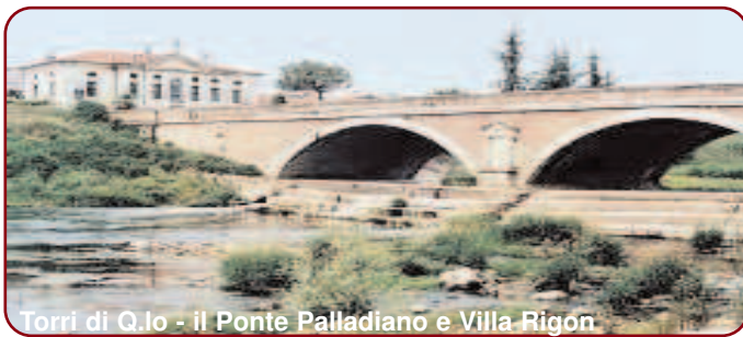
Torri di Q. Io - il Ponte Palladiano e Villa Rignon