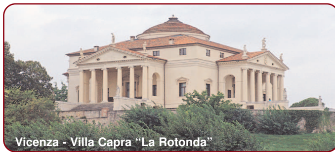
Vicenza - Villa Capra "La Rotonda"